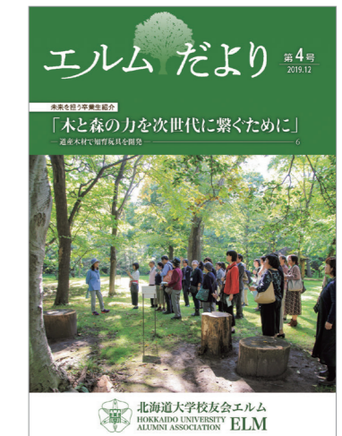
校友会エルム広報誌