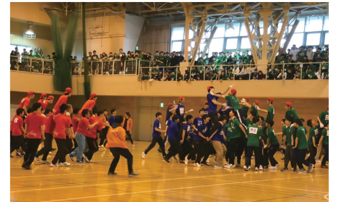
体育会クラスマッチ協賛(2019年度)

「校友会エルム」は、卒業生だけではなく、在学生や教職員、その他本学の知の営みに関するすべての人を構成員とする組織です。在学生、在学生の保護者、教員、職員および卒業生など全ての北海道大学関係者が集い、学部および国内外地区同窓会等と連携して会員の成長・発展を図るとともに、北海道大学が世界水準の大学として社会に果たす使命を支援していきます。