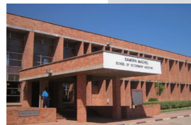
アフリカルサカオフィス 2012年設置