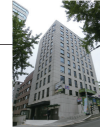
韓国ソウルオフィス 2011年設置