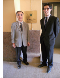
欧州ヘルシンキオフィス 2012年設置