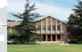
中国北京リエゾンオフィス 2018年設置