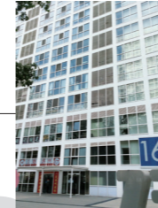
中国北京オフィス 2006年設置