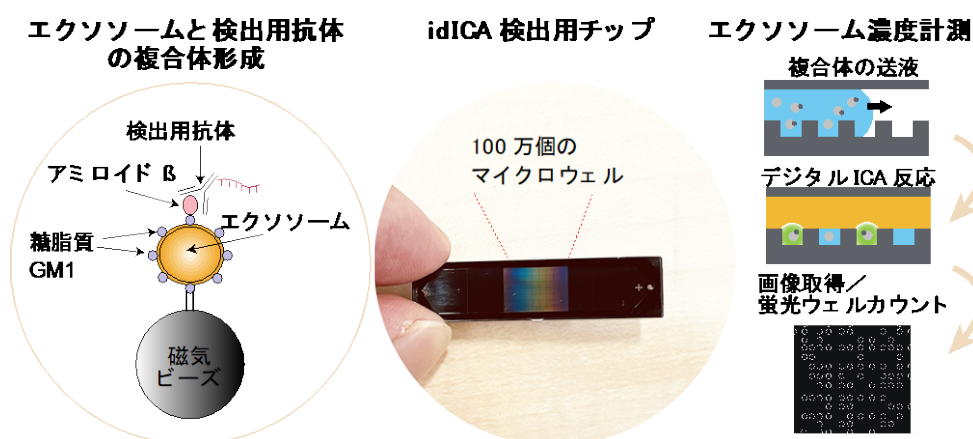
図 1. エクソソームのデジタル計測 (idICA)