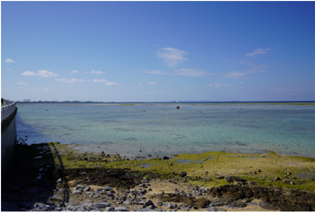
図 1. 広大なサンゴ礁の礁池が広がるカーミージー（沖縄県浦添市）。潮が引くと広大な干潟になる。左奥には、周辺での埋立計画が進む浦添ふ頭が見える。