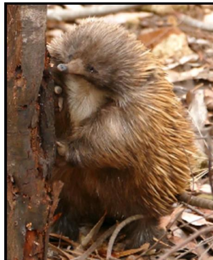
池で泳ぐカモノハシ（左），枯木のシロアリを食べるハリモグラ（右）