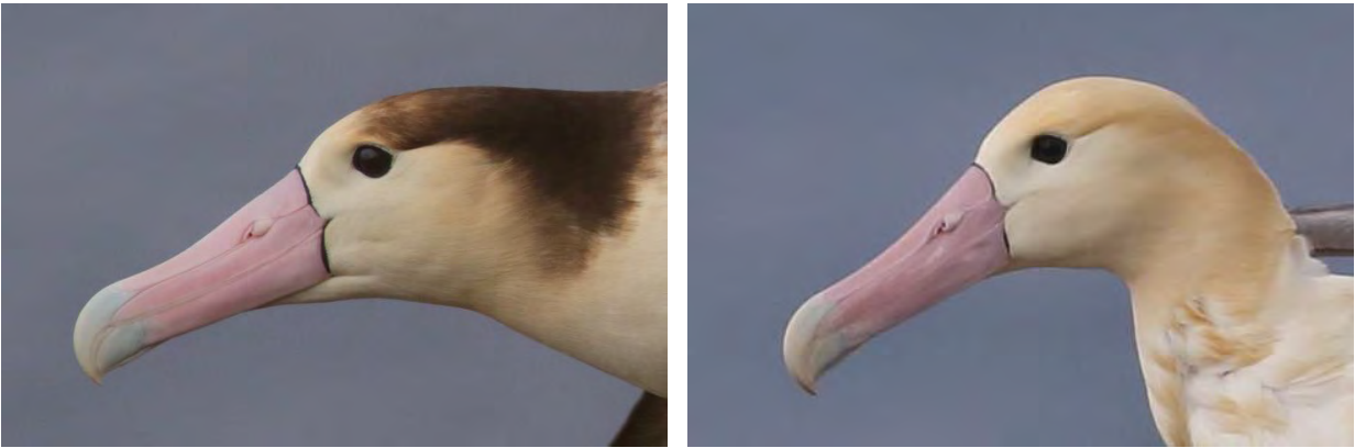
図1. 「アホウドリ」の横顔（左：鳥島タイプオス、右：尖閣タイプオス） 尖閣タイプのくちばしは鳥島タイプに比べて細長い