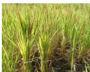
葯培養で得た4倍体雑種の系統群