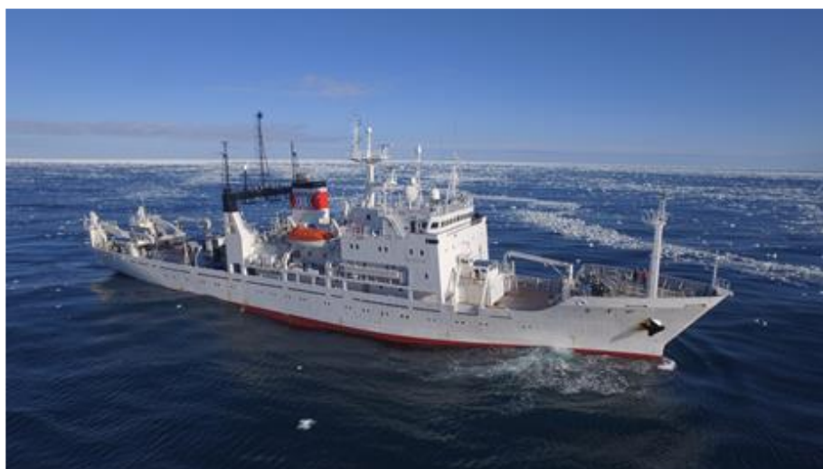
2018-19 年に南極海の観測を行った開洋丸

本研究成果は，2020 年 9 月 15 日（火）公開の Scientific Reports 誌に掲載されました。