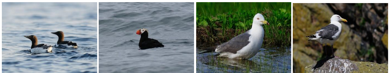
1980 年より大きく減少した 4 種（左からウミガラス，エトピリカ，ウミネコ，オオセグロカモメ）

なお，本研究成果は，2019 年 8 月 28 日（水）公開の Bird Conservation International 誌でオンライン出版されました。