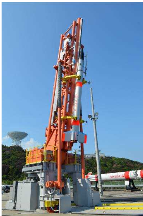
図 1. 実験で用いた観測ロケット S-520 30 号機。内之浦宇宙空間観測所から 2015 年 9 月 11 日に打ち上げた。その後 3 年にわたり、地上実験や、航空機を用いた微小重力実験による再現実験やデータ解析を行った。