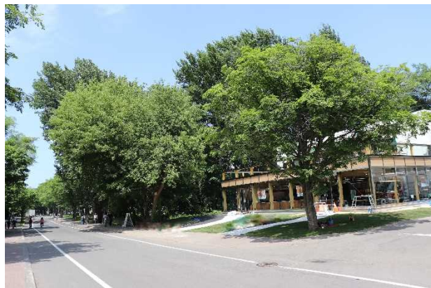
（ストア前のメインストリート）