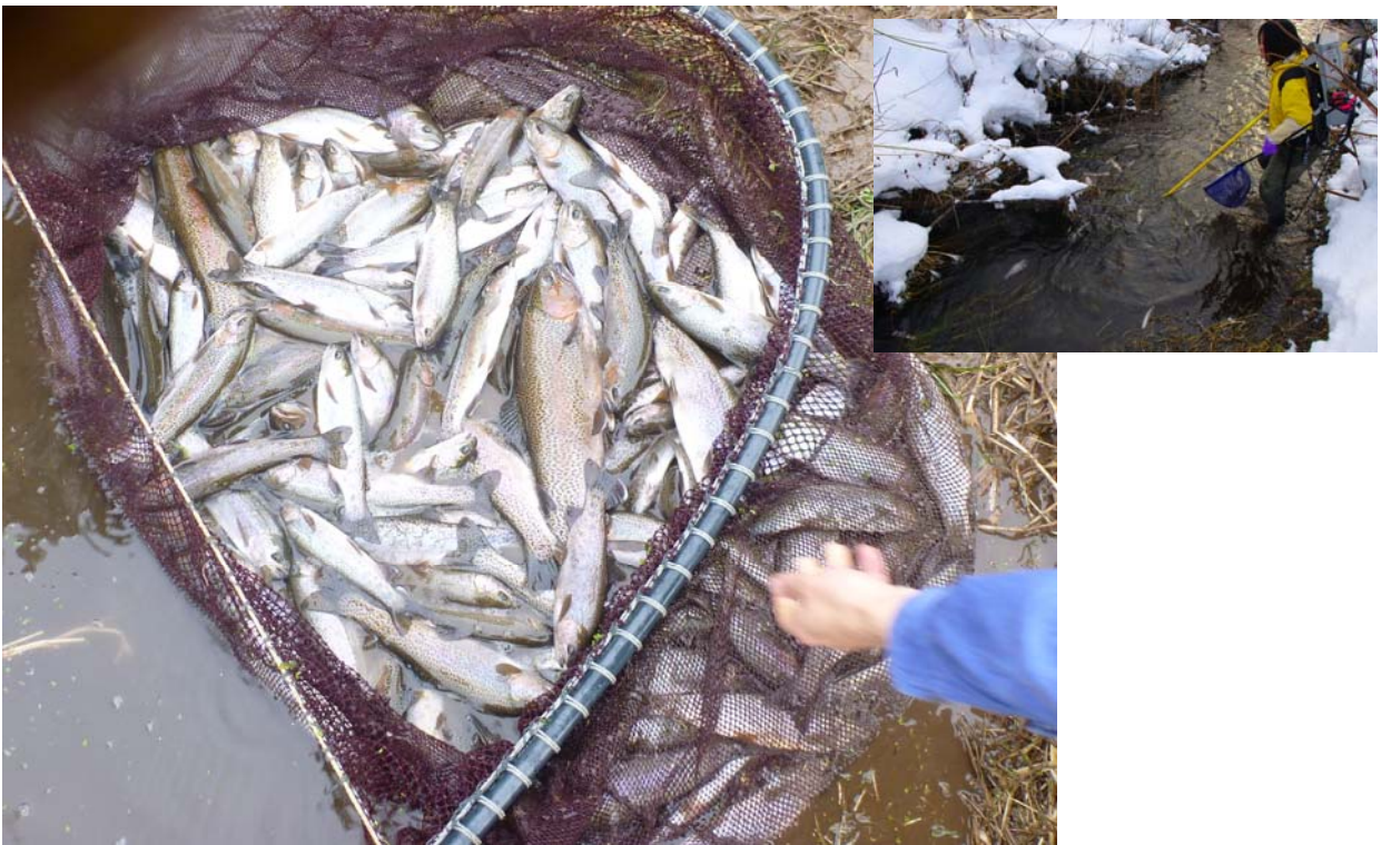
図2. 一つの淵において1時間たらずで捕獲されたニジマス(右上は異なる淵での捕獲の様子)。