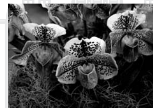
パフィオペディラム Paphiopedilum

ラン科は陸上植物の3大科の一つとされ、2万種にも及ぶ多種多様性を誇っています。ラン科の特徴、多様性と分類体系、人間文化との関わり、花と昆虫との共進化、生物間相互作用などを分かりやすく説明します。